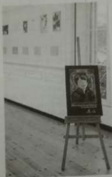
Imaxe da mostra de San Sadurniño

O evento -con entrada libre- estará conducido pola rapazada do Club de Lectura da Biblioteca e contará ademais coa lectura